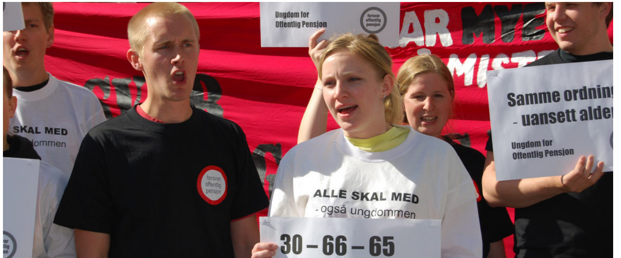
Pensjonskamp: Ungdom for offentlig pensjon aksjonerer.

For mer fra Wergeland om arbeidsliv og folkehelse, se www.ebbawergeland.no