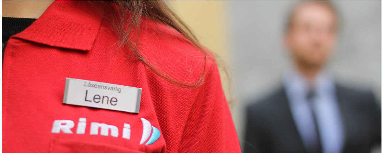
Ufrivillig deltid: Et hinder for likestilling.