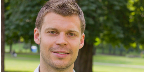
Rødt-leder: Bjørnar Moxnes.