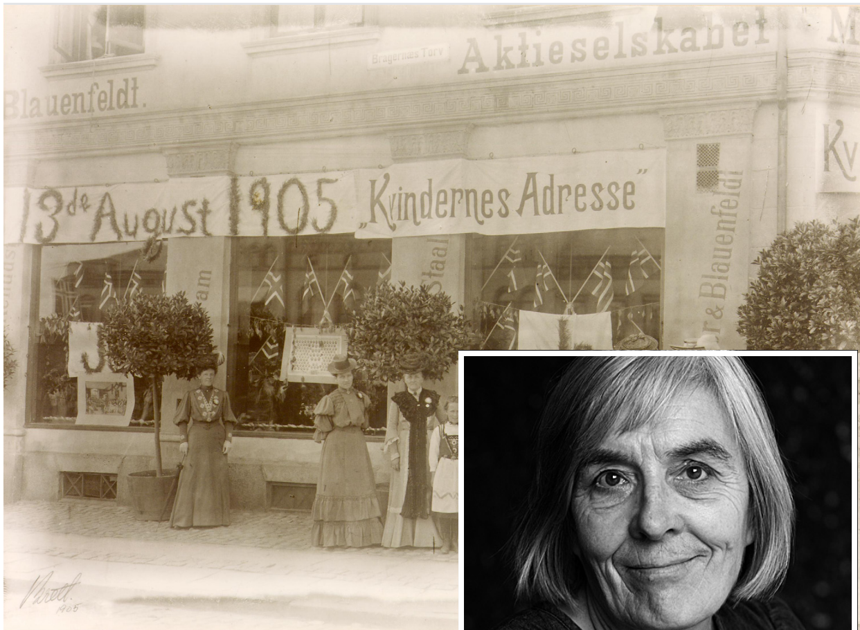
Kvinner i kamp: Leder i Drammens Kvinneraad, Betzy Kjelsberg, aksjonerer for oppløsning av unionen med Sverige. Kvinner fikk ikke delta i folkeavstemningen i 1905.