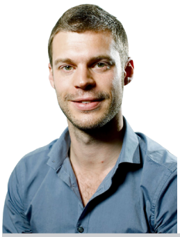
Bjørnar Moxnes b.moxnes@roedt.no Leder i Rødt